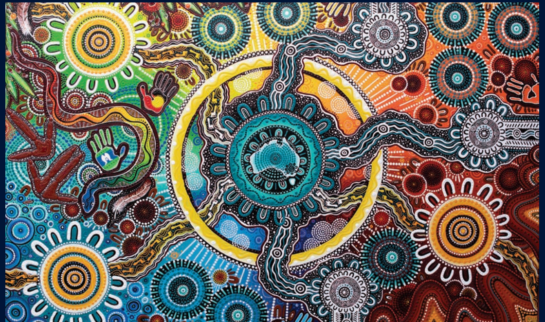
Hành trình của Sport Integrity Australia

Trong tinh thần hòa giải, Sport Integrity Australia (cơ quan Thể thao Chính trực Úc) ghi nhận những Người Giữ Truyền thống của Đất nước trên khắp nước Úc và mối liên hệ của họ với đất liền, biển và cộng đồng. Chúng tôi bày tỏ lòng kính trọng đối với các Bậc Trưởng lão trong quá khứ, hiện tại và tương lai của họ, đồng thời bày tỏ lòng kính trọng này đến tất cả các dân tộc Thổ dân và Đảo Torres Strait. Sport Integrity Australia ghi nhận sự đóng góp nổi bật của các dân tộc Thổ dân và Đảo Torres Strait đối với thể thao ở Úc và tôn vinh sức mạnh của thể thao trong việc thúc đẩy hòa giải và giảm bất bình đẳng.