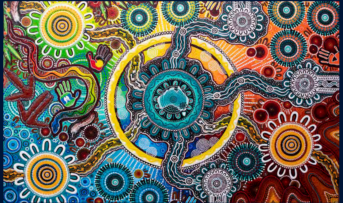
澳大利亚体育诚信组织之路

本着和解的精神，Sport Integrity Australia承认澳大利亚全境的传统土地监护人，以及他们与陆地、海洋和社区的联系。我们向他们的过去、现在和未来的长老们致敬，并向所有原住民和托雷斯海峡岛民致敬。澳大利亚体育诚信组织承认原住民和托雷斯海峡岛民对澳大利亚体育所做的突出贡献，并赞美体育促进和解和促进平等的力量。